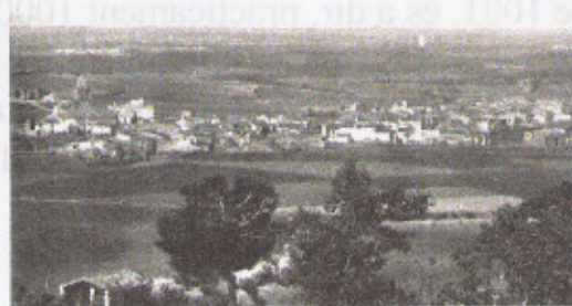
Maçanet de la Selva, cent anys Maçanet de la Selva, un poble amb una història rica i diversa, que ha estat protagonista de molts moments importants de la nostra història. Aquesta imatge aèria mostra el poble i el seu entorn, amb el riu Cardener al fons.

- Diari de Girona. 11/12/99. Dins el col.leccionable "Memòria gràfica de les comarques gironines", monogràfic sobre Maçanet de la Selva. Text i fotos del TdH. - El Col·legi Oficial d'Aparelladors i Arquitectes tècnics de Girona, ha publicat una